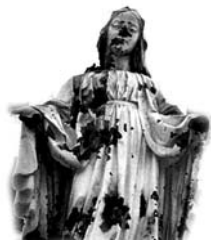
Statua della Santa Vergine di Betlemme sfregiata dalle armi dei soldati Israeliani

Benedetto XVI farà «importanti riforme» prima della fine del 2006 (Adista, 20.5.2006). Cioè, dopo aver fatto un passo indietro per recuperare qualcuno, farà due grandi passi a sinistra. In questo caso il tempo della falsa restaurazione è finito (20 anni) e, come dopo Napoleone, ci saranno due nuovi passi avanti: i motti del 1848... Prepariamoci. Si dichiarerà che la Chiesa romana non è più la Chiesa universale... e allo stesso tempo ci concederanno la Messa, ecc... per farci tacere.