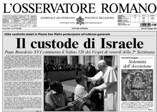
“Il custode di Israele”, O.R. 5.5.2005

Il Papa Benetto XVI alla Delegazione del Centro Simone Wiesenthal, O.R. 14.11.2005: «Promuovere una migliore comprensione tra Ebrei e Cattolici. Dopo una storia difficile dolorosa, i rapporti fra le nostre due comunità stanno attualmente prendendo una direzione nuova e positiva.»