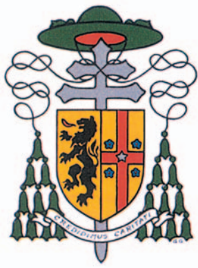
Stemmi di S.E. Mons. Marcel Lefebvre