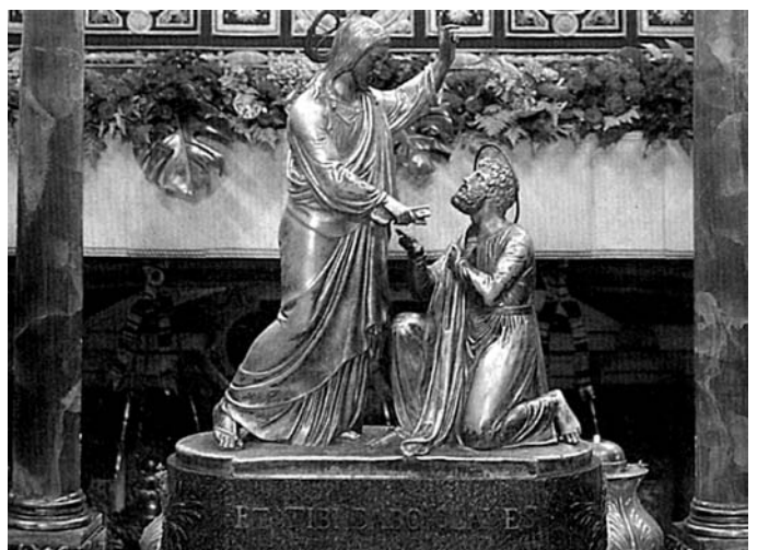
N. S. Gesù Cristo affida le chiavi a Pietro e gli dà il potere d'insegnare la Fede attraverso il Magistero romano. Il potere di comandare, di giurisdizione è per servire la Fede, il contrario è assurdo: il diritto canonico, l'obbedienza, la disciplina sono al servizio della Fede e non il contrario

Leone XIII, Satis cognitum, 29.6.1896: «(False concezioni della Chiesa). Da lì viene il grave e fatale errore di quelli che nel loro spirito e di loro propria iniziativa, concepiscono una Chiesa quasi nascosta e invisibile, come quelli che la considerano una istituzione umana, con una certa organizzazione, una disciplina e dei riti esterni, ma senza una comunicazione perpetua dei doni e della grazia divina e senza tutte