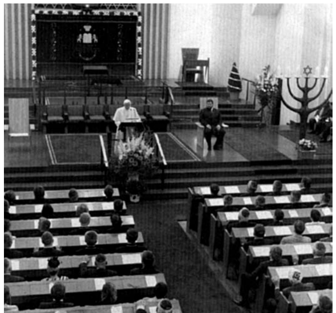
Il Papa benedetto XVI, in occasione del suo primo viaggio apostolico, visita la Sinagoga di Colonia (O.R. 21.8.2005)

Si fonda infatti sul concetto che la Chiesa di Cristo sia composta in parte dalla Chiesa Romana, stabilita e diffusa nel mondo intero, in parte dallo scisma di Fozio e in parte dall'eresia anglicana... Non può assolutamente essere approvata.»