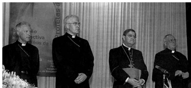
Fatima. I vescovi nascondono la croce pettorale O.R. 26.6.2005,

Leone XIII, 19.07.1889: «Cosicché, una tale libertà mette sullo stesso piano la verità e l'errore, la fede e l'eresia, la Chiesa di Gesù Cristo e qualunque istituzione umana; essa stabilisce una deplorabile e funesta separazione fra la società umana e Dio suo Autore; e alla fine termina con le tristi conseguenze che sono l'indifferentismo dello Stato in materia religiosa, o, ciò che è lo stesso, il suo ateismo.»