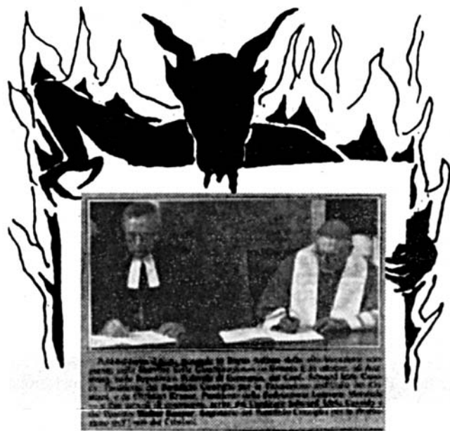
Photo historique de la signature des 44 affirmations communes avec les luthériens, 31 oct. 1999

« ...Allora avvenne un passaggio così evidente dalla Legge al Vangelo, dalla Sinagoga alla Chiesa... Nella Croce dunque la Vecchia Legge morì, in modo da dover tra breve essere sepolta e divenire MORTIFERA (S. Thom., I-II, q. 103, a. 3 ad 2; a. 4 ad 1, Concil. Flor., pro Jacob; Mansi, XXXI, 1738) »