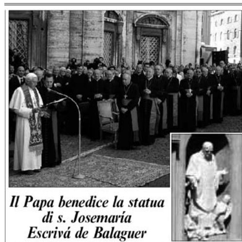
Il Papa benedice la statua di s. Josemaría Escrivá de Balaguer

Noi vi consideriamo come i soldati che lottano per il popolo di Dio.» (Mansi, t. XX, coll. 824-826).