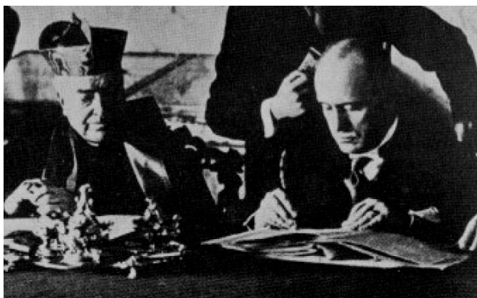
Concordato del 1929 fra la Chiesa e il Governo Mussolini «La Religione cattolica è la religione di Stato» Pio XI: «È un dogma di Fede cattolica»

Mons. Celestino Migliore, capo della Delegazione della Santa Sede per la eliminazione di ogni forma di intolleranza, O.R. 13.11.2004: [loro stessi riconoscono che la libertà religiosa produce nuove forme di intolleranza] «La libertà religiosa è una condizione per raggiungere il bene e la vera felicità... può sembrare paradossale riconoscere che in quest'era