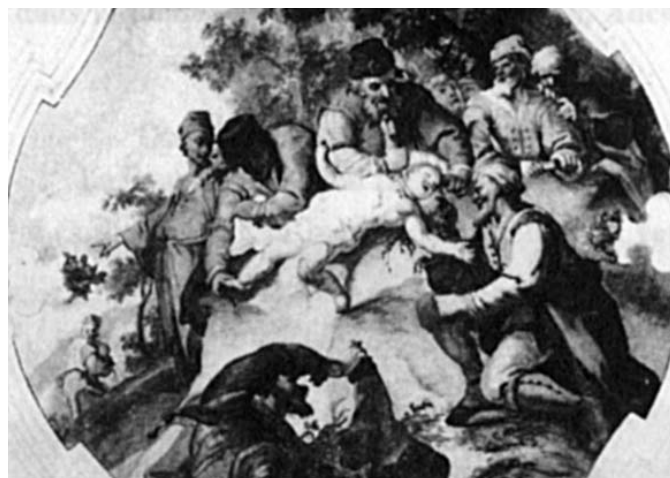
Il martirio di san Simonino, ex patrono della città di Trento, fu tolto dopo il Concilio Vaticano II. Un esempio storico, tra gli altri, dell'odio dei giudei verso il cattolicesimo, segnalato dallo stesso Magistero romano

Il Re è sollecitato a porre fine a tali malvagità. Le stesse “malvagità” continuano ad essere menzionate da vari Papi per secoli e ad essere completamente ignorate da altri.