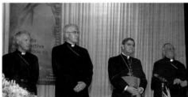
O.R. 26.06.2005, Fátima: los obispos esconden su cruz.

comunidades , semejantes en algún aspecto, pero distintas y no unidas entre ellas por aquellas ataduras que forman una sola e indivisible Iglesia, de tal manera que, recitando los símbolos de la fe, nosotros decimos: “Yo creo en la única Iglesia”».