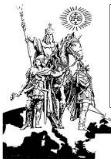
Carlo Magno empieza a unificar la Europa en la Fe Católica y Romana.

El Papa Benedicto XVI , O.R. 25.06.2005: " Una sana laicidad del Estado es legítima, en virtud de la cual las realidades temporales son regladas en función de reglas que son propias ".