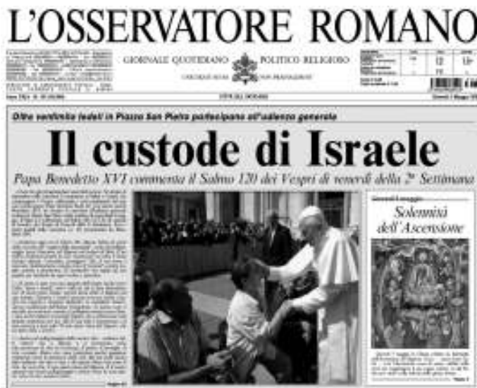
“El custodio de Israel”, O.R. 05.05.2005.

Pío XII, 21.3.1957: «... toda la Iglesia de Cristo es un cuerpo vivo... pero aquí en Roma, es decir en el corazón de este gran organismo... esta catolicidad... une a todos en un abrazo común de fraternidad inefable...«Ustedes, desde Roma, con su sacerdocio romano, pueden llevarse un grado mayor de generosa catolicidad... En donde hoy muchos ven el porvenir y la salvación del mundo. En fin, parece claro que la romanidad debería significar también el sentimiento profundo y arraigado, de que en Roma está el centro de la Iglesia...» .