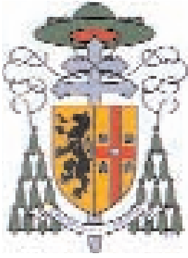
Wappen S.E. Mons. Marcel Lefebvre